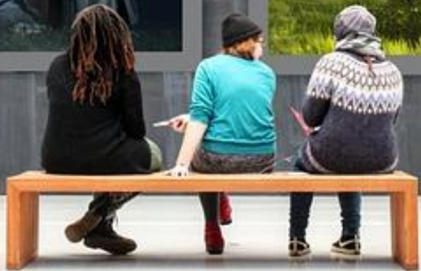
Les élèves de Foudlart rêvent du temps où la magie était possible